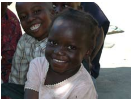
Auch dieses Mädchen wächst nach dem Tod seiner Eltern bei seiner Großmutter auf. Das AIDS-Waisen-Projekt trägt hier maßgeblich zum Überleben bei.

Angesichts der großen Zahl von AIDS-Waisen in den Gemeinden ist der Bedarf an Unterstützung leider weit größer, als die Möglichkeiten des Projekts es sind.