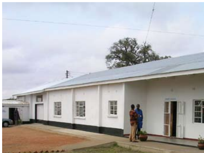
Sichtbares Zeichen der Partnerschaft in Choma: das CHODORT-Training-Centre

Erste Lieferung von Medikamenten in das „Kalomo Hospital“ in Zusammenarbeit mit dem deutschen Medikamenten-Hilfs-