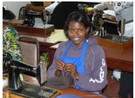
Begehrte sind die Ausbildungs- plätze in der Schneiderei