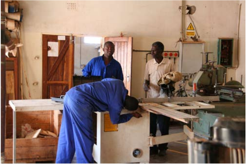
In der CHODORT-Werkstatt

regelmäßigen Beiträgen der Gemeinden des ehemaligen Kirchenkreises Dortmund-Nordost sind in Choma (direkt neben der dortigen St.-Stephens-Kirche) Ausbildungs- und Produktionswerkstätten für Schreiner, Schneiderinnen und (seit 2007) Bürokräfte entstanden. Gegenwärtig erhalten ca. 80 junge Frauen und Männer dort