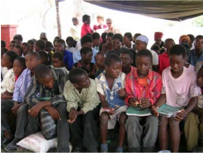
Kinder bei der monatlichen Verteilung von Lebensmitteln und Schulmaterial

Ferner bekommen die im Projekt versorgten Kinder regelmäßig Grundnahrungsmittel und Kleidung sowie das Geld für die in Sambia seit einigen Jahren erhobenen Schulgebühren.