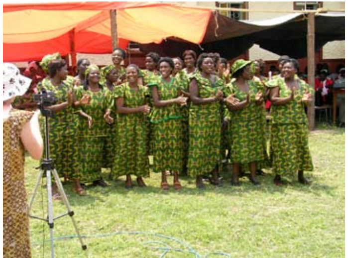
Schneiderinnen des CHODORT-Training-Centres bei der offiziellen Eröffnung 2004

Ergänzung des CHODORT-Zentrums um den Ausbildungsgang Schneiderei (ca. 40 Auszubildende)