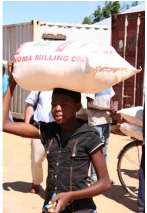
Ein Sack Mais-Mehl reicht pro Kind für einen Monat - und kostet ca. 8 Euro.

Dabei erhalten alle Kinder und Jugendlichen eine erwachsene Begleiterin, die sich ständig oder in regelmäßigen Abständen um sie kümmert.