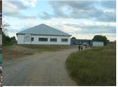
Die Klein-Klinik in Kalomo ist die einzige Gesundheitseinrichtung für viele Tausend Menschen in der Umgebung. Medikamente gegen Malaria, Infektionen und AIDS sind oft gegen Mangelware.