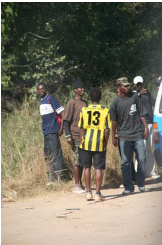
Dortmunder Spuren in Sambia...

Partnerschaft bewährt sich auch im Teilen – solidarisches Handeln war deshalb von Anfang Teil der Verbindung zwischen Choma und Dortmund. Im Laufe der Jahre haben sich dabei bisher drei Schwerpunkt-