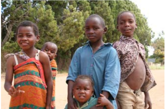
Auch in Choma wachsen sehr viele Kinder als Waisen auf

Frauen aus dem Kirchenkreis Choma haben seit 2001 ein Projekt zur regelmäßigen Unterstützung von erst 35, mittlerweile 150 Kindern und Jugendlichen aufgebaut, das maßgeblich aus Dortmund finanziert wird.