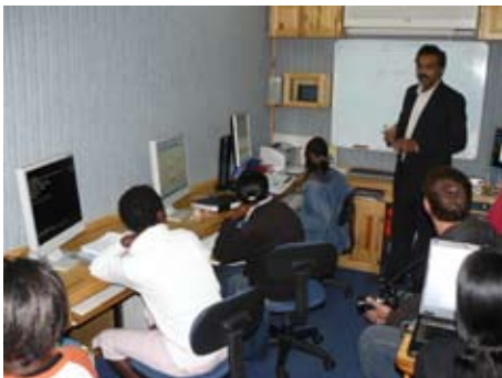
Ein neuer, erfolgreicher Ausbildungszeitung: die Computer-Ausbildung in CHODORT

Ziel des Projekts ist es, den Absolventen von CHODORT den Aufbau einer selbständigen Existenz zu ermöglichen. Zahlreiche ehemalige Auszubildende haben in