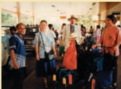
Ankunft in Sri Lanka.