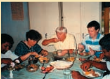
Essen mit den Fingern.

Parallel zur Entwicklung der Partnerschaft mit Sri Lanka gab es in Dortmund in den 80er Jahren Projekte mit tamilischen Flüchtlingen. Ehrenamtliche halfen den Einwanderern: Beim Umgang mit Behörden, beim Einkauf, beim Deutsch lernen und bei den Hausaufgaben der Kinder. Eine tamilische Lehrerin, so stellte sich heraus, unterrichtete Tanzen. Sie bot Kurse für Kinder an. Später traten die Kinder auf: in Dortmund auf dem Alten Markt, bei Gemeindefesten und sogar in Marl. Der sri lankische Tanz ist ein religiöser Tanz und so musste die Bedeutung der Tänze zuvor erklärt werden. In einem besonderen Fall setzte sich der Partnerschaftskreis gegen die Abschiebung einer tamilischen Familie ein.