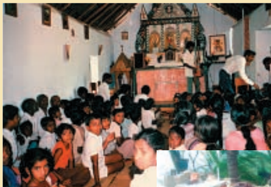
Kirche in Sri Lanka.