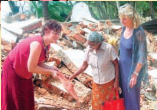
Nach dem Tsunami in Sri Lanka.