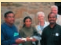
Delegation 2006 in Dortmund-Kirchderne.

Der Kirchenkreis Dortmund-Mitte-Nordost, gegründet 2002, hat die Partnerschaft mit der Methodistischen Kirche von Sri Lanka von dem ehemaligen Kirchenkreis Dortmund-Mitte übernommen. Eine weitere Partnerschaft zum Kirchenkreis Choma in Sambia ist ein Erbe des früheren Kirchenkreises Nordost.