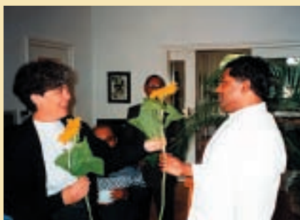
Sonnenblumen für die Partnerschaft.