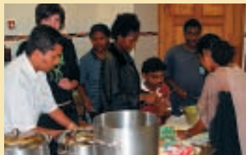
Kochen mit Gästen aus Sri Lanka.